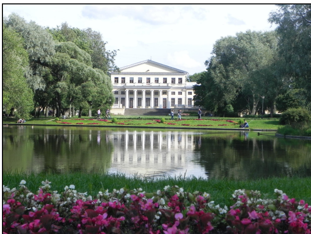
Юсуповски парк и дворец

Други обекти, включени в плана на организираните посещения, бяха: катедрални храмове (Исакиевски събор, Казански катедрален събор, Троицки събор, Морски събор, Казашки събор); Строгановски дворец и Михайловски парк (от музейния комплекс на Руския музей); Юсуповски дворец (на р. Мойки); Юсуповски парк и дворец (понастоящем филиал на Санкт-Петербургски държавен университет по пътища и съобщения); Марински театър; Марсово поле и вечния огън; Ленинградски зоопарк; Павловски парк и дворец – гр. Павловск; Екатеринински парк и дворец (Царско село) – гр. Пушкин; Музей на Фаберже; Музей на камъка; Музей на шоколада. Организирана беше нощна разходка в Санкт Петербург по време на белите нощи и разделянето на мостовете.