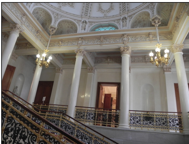
Музей на Фаберже