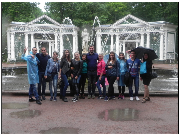
Дворцово-парков ансамбъл „Петерхоф“