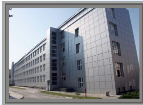
Учебен корпус №2 след проекта