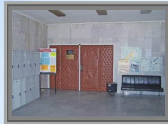
Библиотека преди проекта