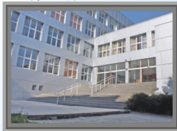
Учебен корпус №2 след проекта