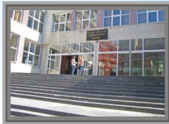
Учебен корпус №2 преди проекта